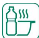
HUILES DE FRITURE

Séparation et dépollution : Conliège (39)