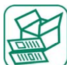
PAPIERS / CARTONS

Pulpage, malaxage, pressage : Papeterie de Novillars (25)