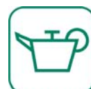
HUILES DE VIDANGE